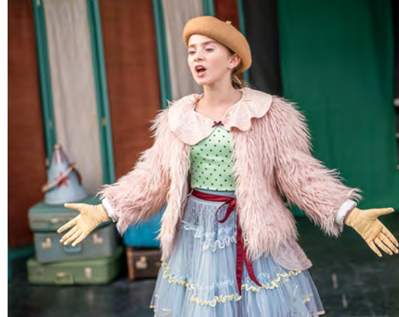
Moje życie to cyrk