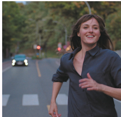
NAJGORSZY CZŁOWIEK NA ŚWIECIE reż. Joachim Trier, Norwegia 2021, 121'