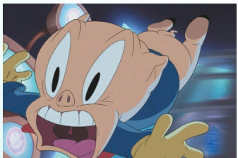
LOONEY TUNES: PORKY I DAFFY RATUJĄ ŚWIAT reż. Peter Brownardt, USA 2024, 91'