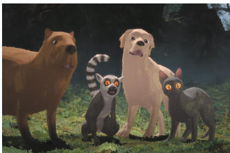
FLOW reż. Gints Zilbalodis Francja, Łotwa, Belgia 2024, 84'