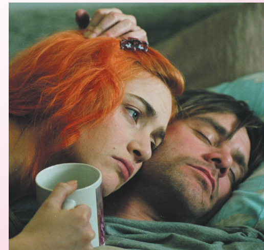
ZAKOCHANY BEZ PAMIĘCI reż. Michel Gondry, USA 2004, 108'