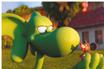
SMOK DIPLODOK reż. Wojtek Wawszczyk Polska, Czechy, Słowacja 2024, 93'