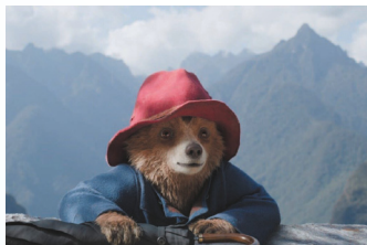
PADDINGTON W PERU reż. Dougal Wilson Wielka Brytania, Francja, USA 2024, 103'